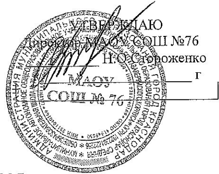
График проведения ВПР в 2025 году